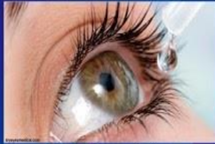
Cara Pemakaian Obat Tetes Mata