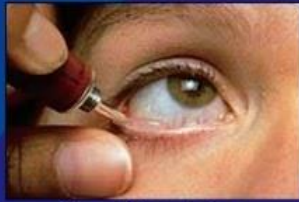
Cara Pemakaian Obat Salep Mata