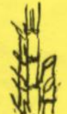
Potongan bambu yang terisi air