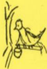
Tempat minum burung