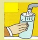
Mudah merasa haus