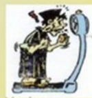
Berat badan menurun Tetapi nafsu makan bertambah